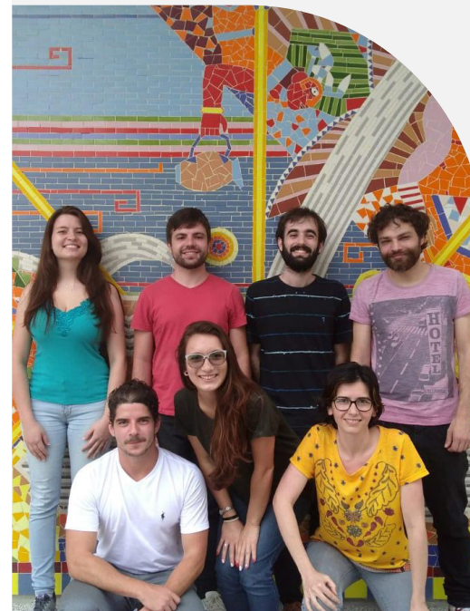
Integrantes do Projeto Teoria da História na Wikipédia em 2018.

Em 2022, Varella e Figueredo desenharam o Projeto Mais Teoria da História na Wiki, junto com integrantes de iniciativas anteriores, majoritariamente desenvolvido em ambiente on-line. O objetivo do projeto é contribuir para a atuação de historiadores e de pessoas formadas ou em formação das áreas correlatas nas plataformas gerenciadas pela Fundação Wikimedia, que estão em sintonia com a ciência aberta e com a construção do conhecimento coletivo e colaborativo. O foco principal deste projeto de história pública está voltado à edição de temas relacionados