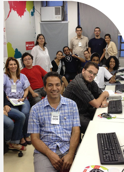
Oficina de edição na Wikipédia na UNIRIO em 2012.